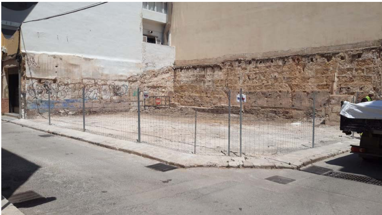
Imatge 2. Vista de la parcel·la.