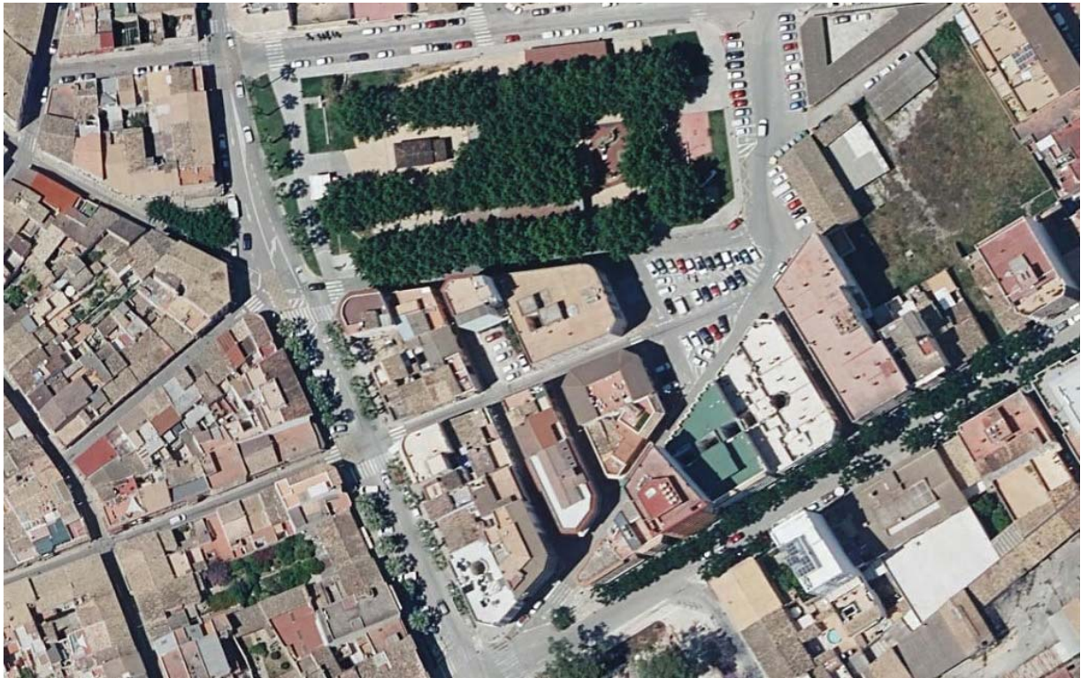
Imatge 1. Orto-fotografia de 2021.

L'àmbit de l'actuació de la present modificació puntual (MP) es situa dins el terme municipal d'Inca, concretament a la parcel·la situada al carrer De La Gloria nº 149.