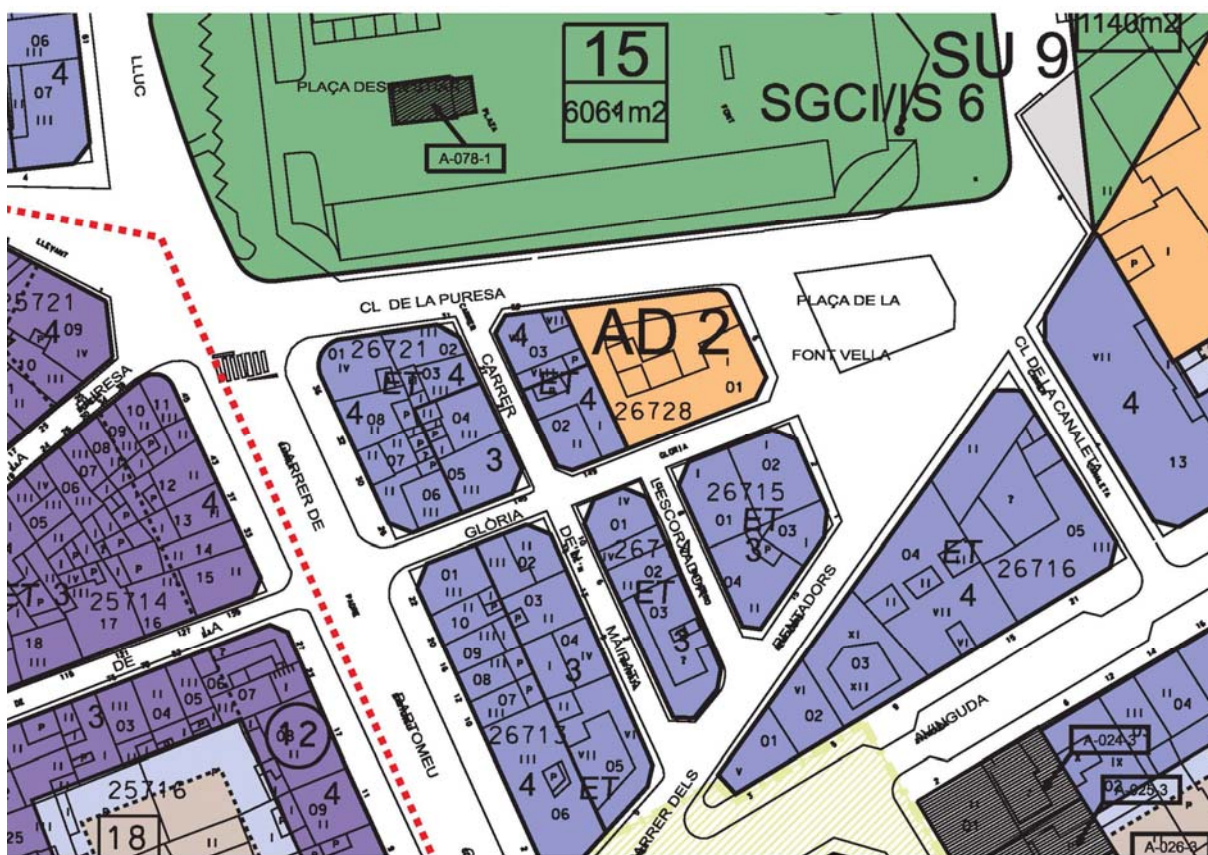
Imatge 7. Plànol modificat del Pla General d'Ordenació Urbana d'Inca 2012. Full C2.

La modificació afectaria exclusivament a l'altura permesa, passant de 3 plantes a 4 plantes. Quedant el plànol del PGOU de la següent manera: