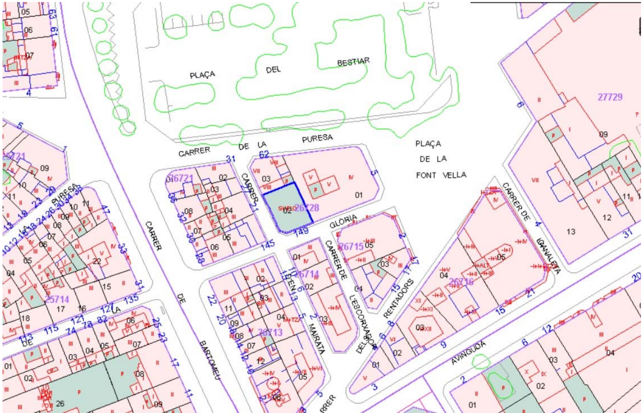
Imatge 3. Cartografia cadastral.